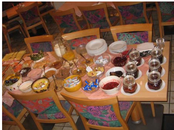
Das war alles nur für uns!

Wenn wir länger geblieben wären, dann hätten wir jetzt ein paar Kilos mehr, so gut ist es uns gegangen! Aber wir kommen wieder, versprochen!